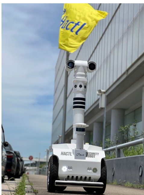
配備人工智能視像分析功能和 5G 專用網絡的巡邏機械人有助加強保安