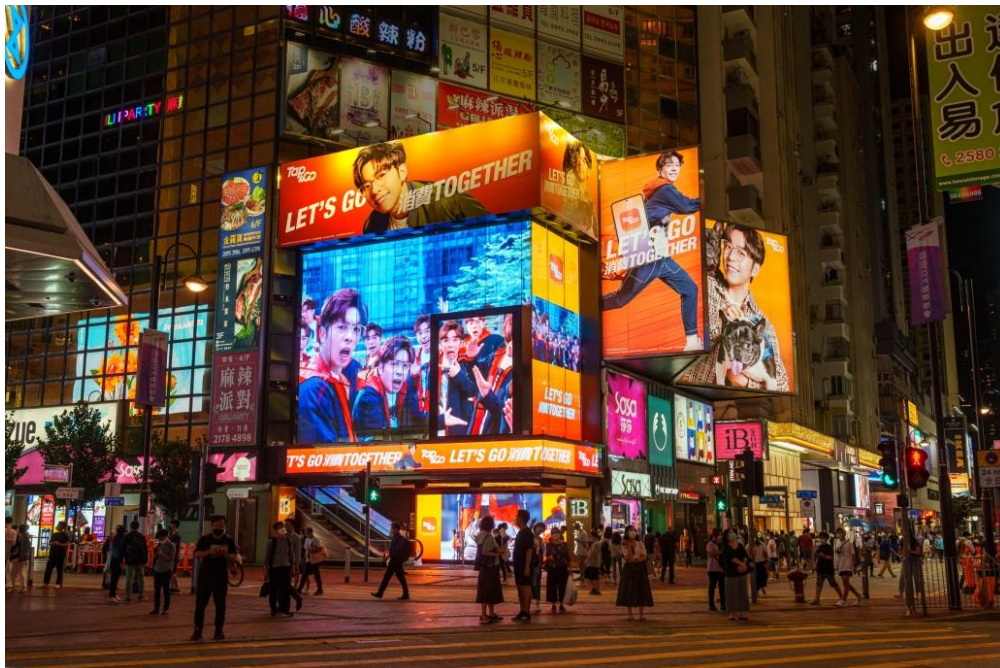
宣傳短片現於銅鑼灣金百利商場的露天巨型廣告板

Edan 為 Tap & Go「拍住賞」拍攝的宣傳短片現於銅鑼灣金百利商場的露天巨型廣告板播放至 6 月下旬，同場更有一系列 Edan 型格造型照，各位「爵屎」們切勿錯過打卡機會。此外，三款不同 Edan 造型的巴士廣告將穿梳香港、九龍及新界，巴士路線詳情稍後於 Tap & Go「拍住賞」Facebook 專頁公佈，「爵屎」們可捕捉 Edan 的蹤影。