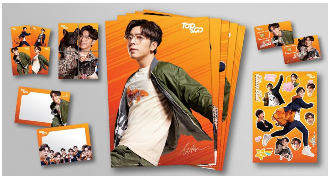
一系列 Edan 簽名版限量禮品

有關第 1 激及第 2 激獎賞詳情，請瀏覽 https://cvs.tapngo.com.hk/chi/phase2-campaign.html 。